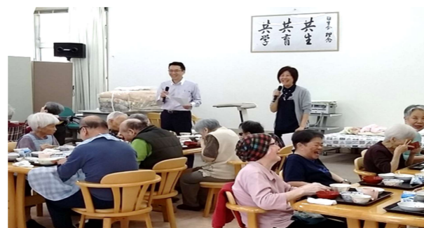
✿食堂ホールにて、肥後狂句会を開催しました✿