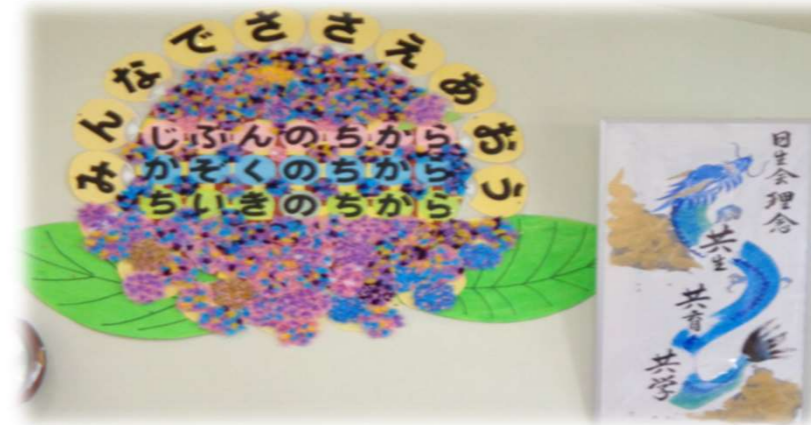
入所者様と職員であじさいの花飾りを作って貼りました！